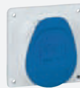
Socle de tableau 3P+T 32 A - 200/250 V~