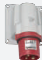
Socle de connecteur 2P+T 16 A - 380/415 V~