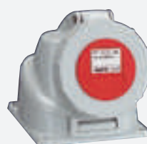
Socle saillie 2P+T 16 A - 380/415 V~