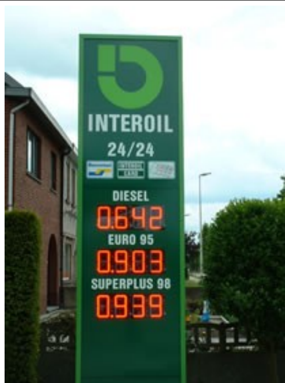
Grand afficheur 7 segments à LEDs

Département Génie Electrique et Informatique Industrielle